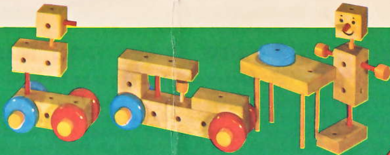
Vogel auf Rädern