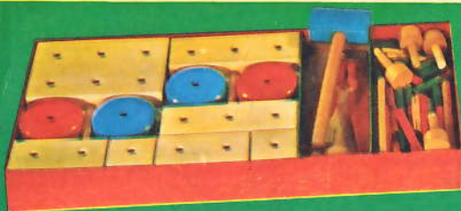
Matador Großformat Nr. Ki 1